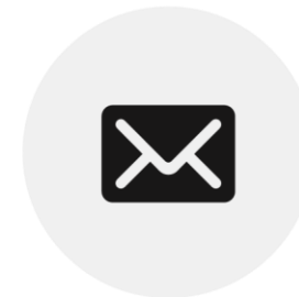
Guichet de la Poste