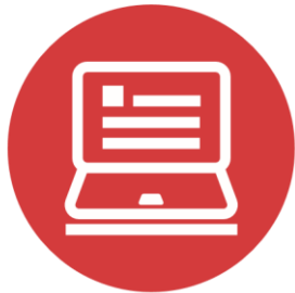
Contenu du site web