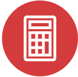
Calculateur Zakat en ligne